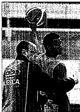
AL DETALLE. Cada gesto cuenta.