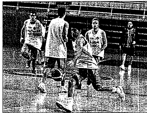
SIN FRENO. La jornada de descanso no debe parar al Huesca.